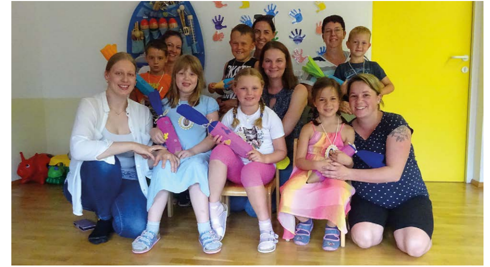
Für die „Wiff-Zacks“ geht es in die Schule.