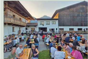
Platzkonzert in der Watsch am 25.6.2025