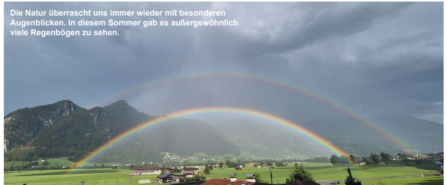
Die Natur überrascht uns immer wieder mit besonderen Augenblicken. In diesem Sommer gab es außergewöhnlich viele Regenbögen zu sehen.

Hier die Broschüre „Stromfresser waren gestern!“ downloaden