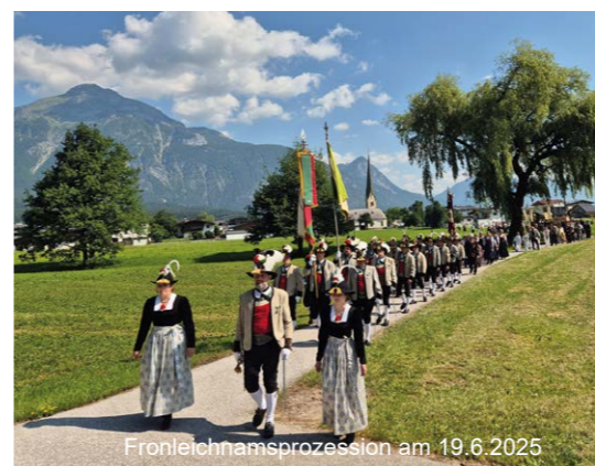
Fronleichnamprozession am 19.6.2025