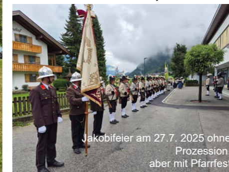
Jakobifeier am 27.7.2025 ohne Prozession, aber mit Pfarrfest