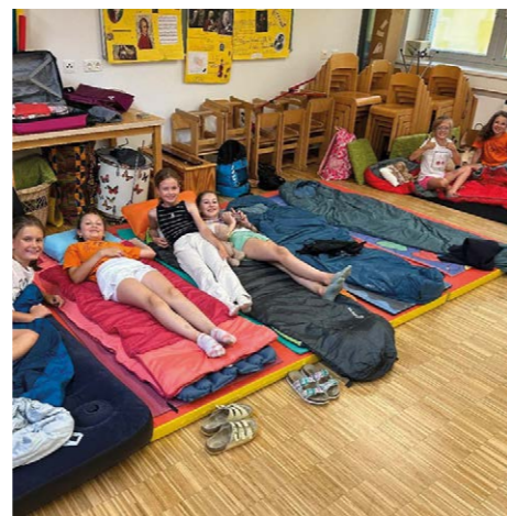
Eine Nacht in der Schule