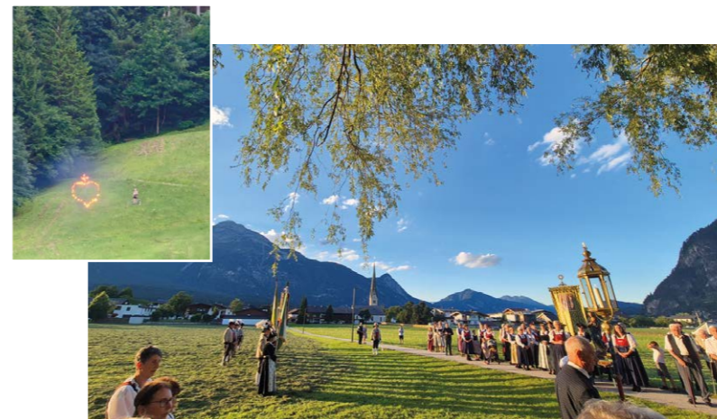
Herz-Jesu Prozession am 28.6.2025