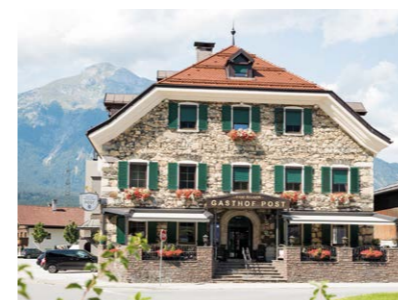
Gasthof Hotel Post Oberdorf 6, 6261 Strass i.Z. 05244 62119 gopost.at