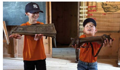
Besuch im Bauernhöfe Museum