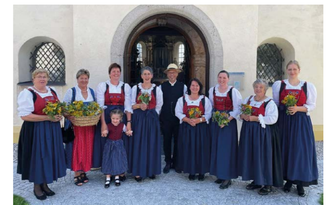
Kräuterweihe am Hohen Frauentag, 15.8.2025